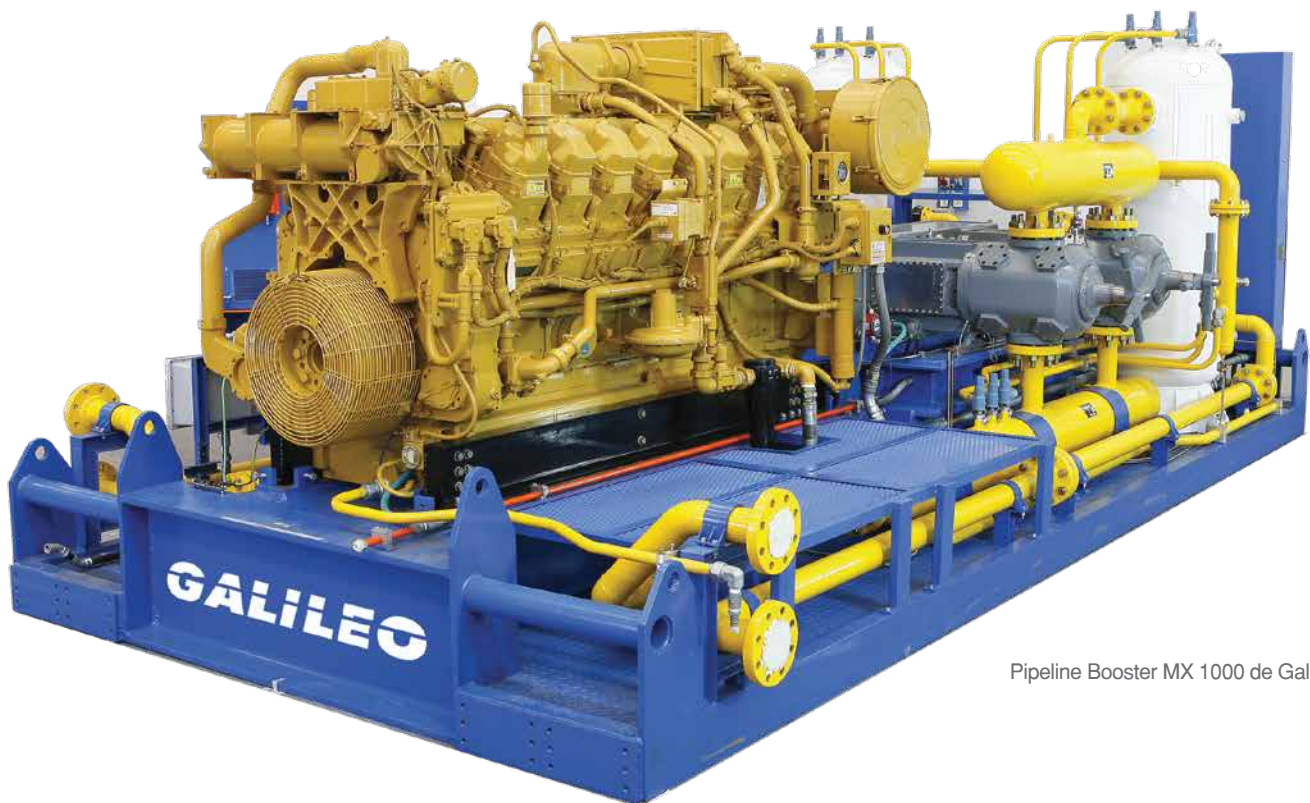
Pipeline Booster MX 1000 de Galileo