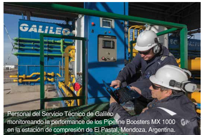
Personal del Servicio Técnico de Galileo monitoreando la performance de los Pipeline Boosters MX 1000 en la estación de compresión de El Pastal, Mendoza, Argentina.

Al igual que los vástagos de 50,8 mm (2") de diámetro, fabricados en SAE 4140, las camisas de cilindro están tratadas superficialmente con nitrurado iónico para aumentar la dureza de los cilindros y reducir el desgaste y la corrosión.