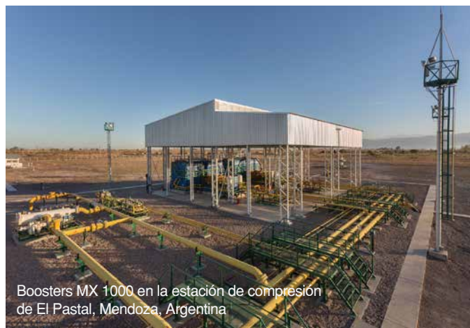
Boosters MX 1000 en la estación de compresión de El Pastal, Mendoza, Argentina

Para revertir la caída de presión resultante, la compañía distribuidora de gas Ecogas, construyó una estación de compresión en El Pastal, Provincia de Mendoza, que cuenta con dos Pipeline Boosters Galileo, equipados con compresores recíprocos MX 1000 de 4 carreras.